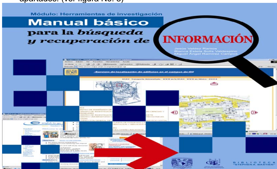
Figura No. 3 Manual básico para la búsqueda y recuperación de la información

B. El Tutorial “Sesión inicial para la búsqueda y recuperación de la información” , se fundamenta en los aspectos teóricos del aprendizaje significativo, además de atender a los aspectos de diseño en plataformas